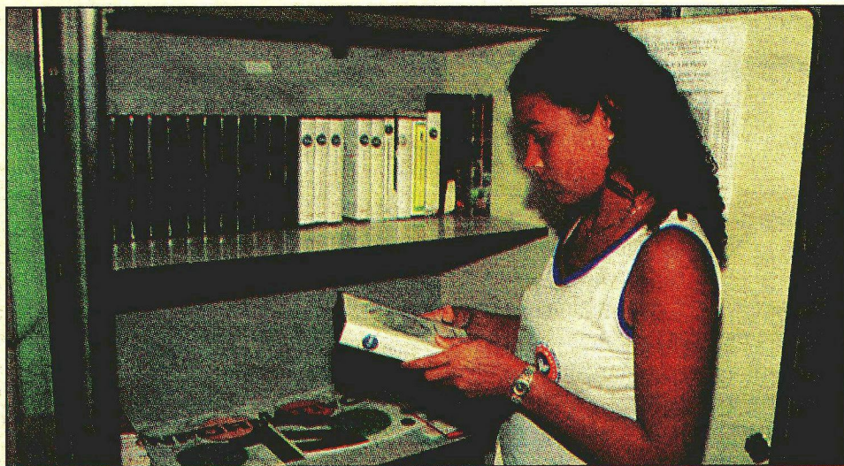
• As videotecas são utilizadas para o enriquecimento das aulas tradicionais