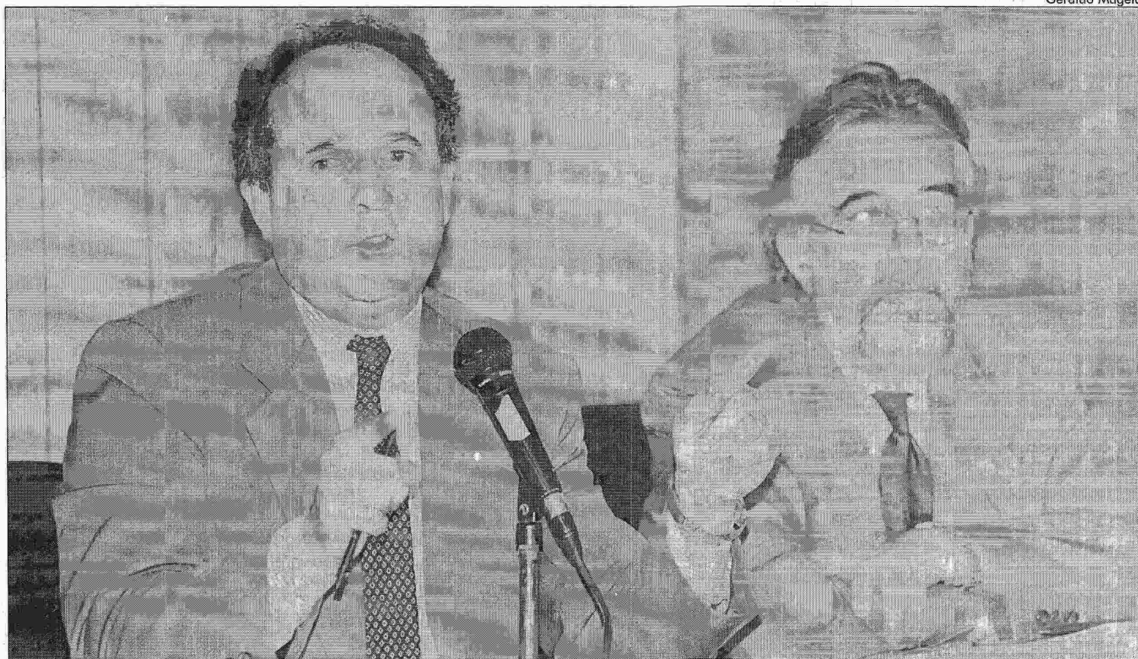
O GOVERNADOR Cristovam e o secretário de Educação, Antônio Ibañes, asseguraram ontem que ninguém ficará sem vaga na rede pública

colocar 1.261 alunos que não foram atendidos inicialmente nas escolas pretendidas e 1.446 nos cursos profissionalizantes. São esses que Cristovam Buarque garantiu que não ficarão fora da escola