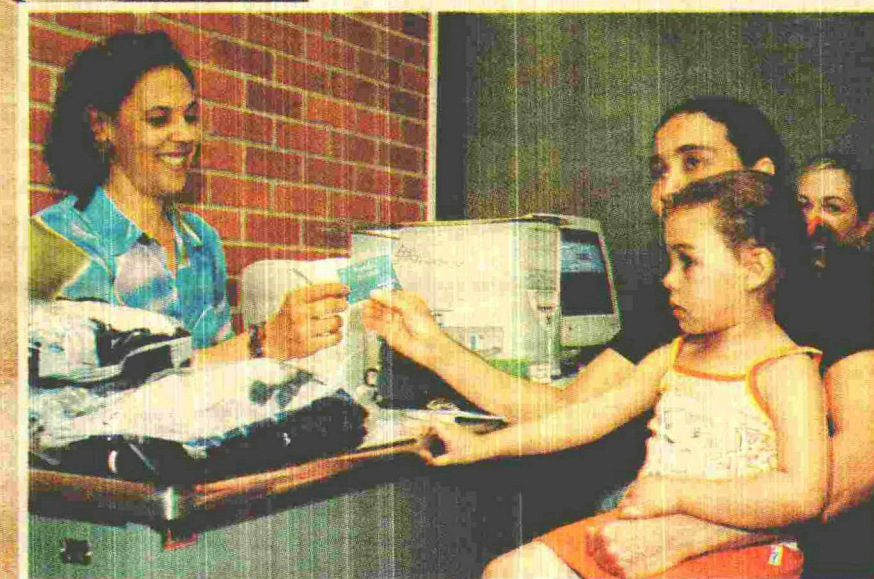
Menos burocracia facilita a vida dos pais