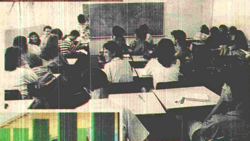
O ambiente escolar permite o pleno desenvolvimento da proposta pedagógica da Secretaria de Educação