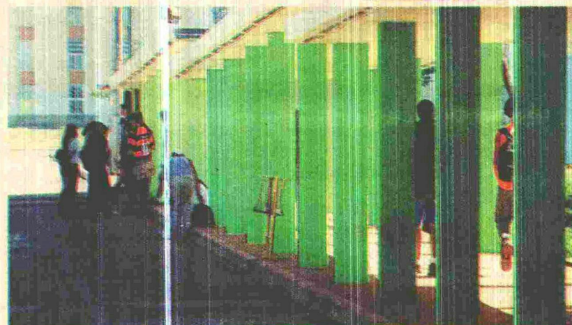
A estrutura física da rede pública de ensino, ampla e conservada, é uma verdadeira extensão da casa do aluno