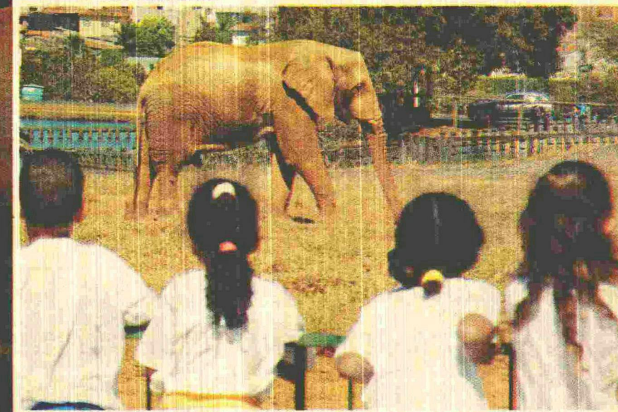
As ações extraclasse complementam o aprendizado