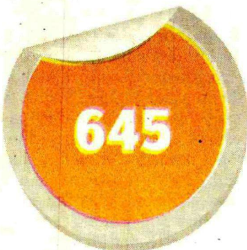
Total de escolas públicas no Distrito Federal

O IDDF medirá a qualidade do ensino da rede pública a partir da combinação de dois indicadores: o desempenho dos alunos no Sistema de Avaliação de Desempenho das Instituições Educacionais do Distrito Federal (Siade) e a taxa de movimentação (repetência e abandono). O cruzamento dos dados revelará a posição de cada escola no cenário da educação brasileira. O resultado será comparado anualmente com o da própria escola. Assim, cada centro de