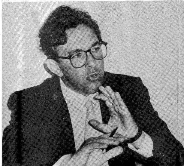
Selligman quer evitar traição aos peemedebistas