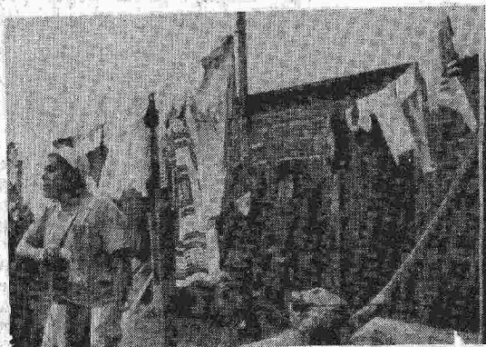
Conceição denuncia abusos com o leite