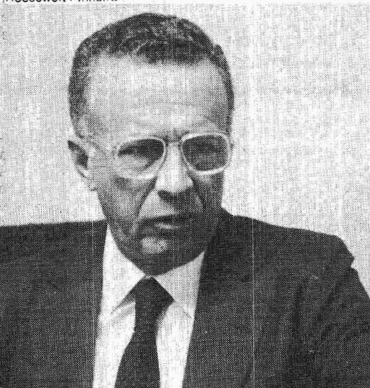
Osório gostou dos números