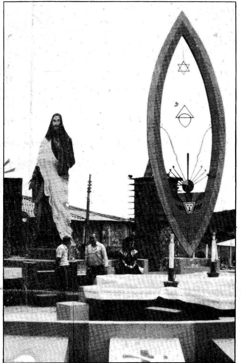
O Vale do Amanhecer também mostra seu lado comunitário

□ BRASÍLIA MÍSTICA — Vídeo de Octávio Conte Vuono, produzido pela Apoio. Duração: 20 minutos. Disponível, a partir de hoje, nas locadoras, livrarias e bancas de jornal, acompa-