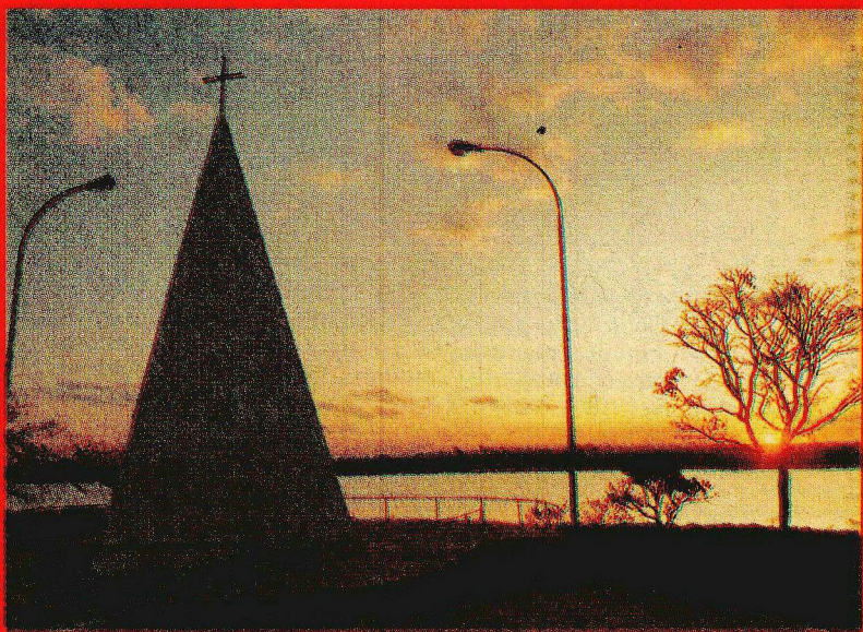
Ermita Dom Bosco: marco do nascimento da chamada “Terra Prometida”