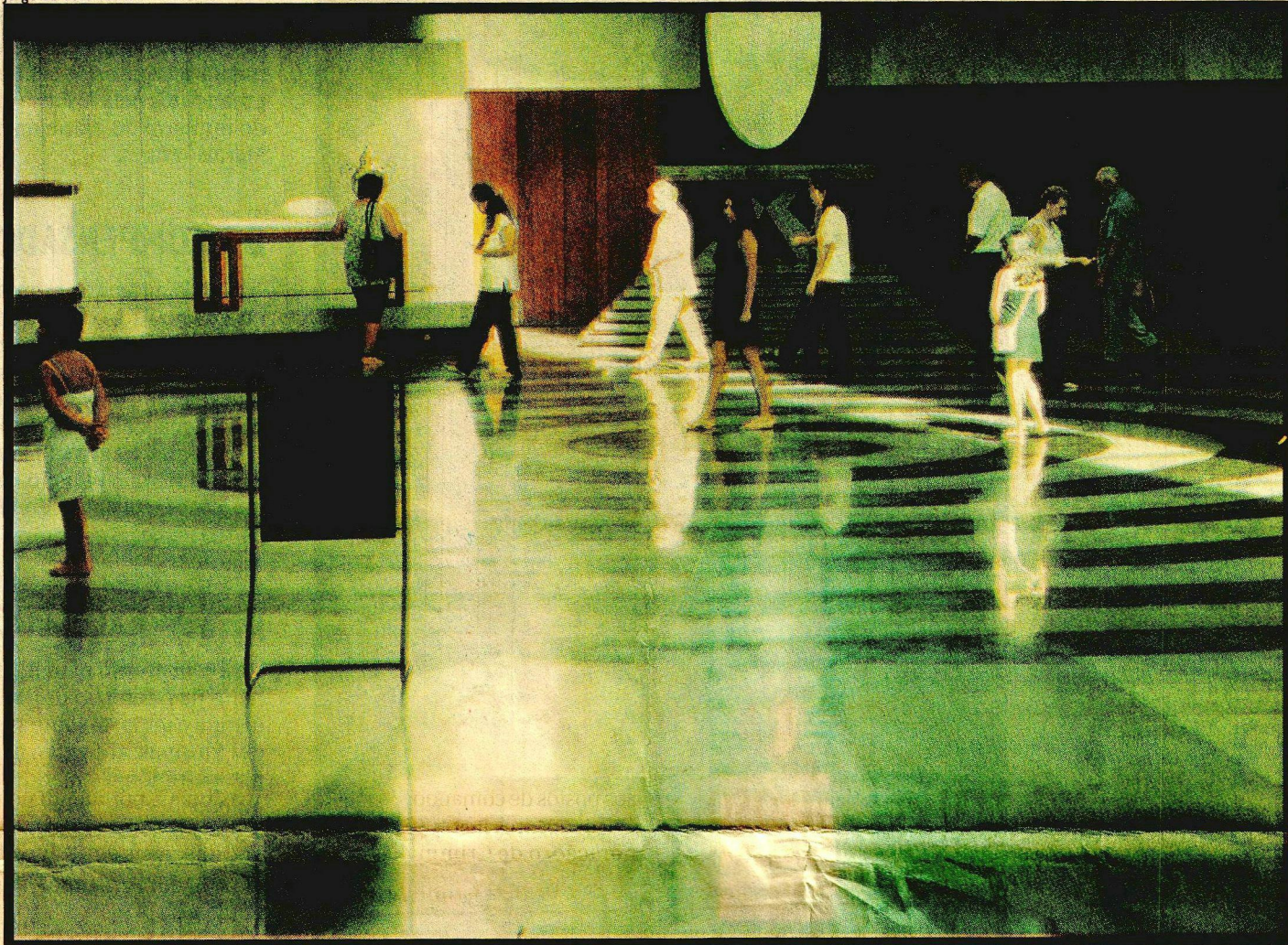
NA NAVE CENTRAL DO TEMPLO DA LEGIÃO DA BOA VONTADE, VISITANTES FAZEM A CAMINHADA EM ESPIRAL, QUE SIMBOLIZA A EVOLUÇÃO HUMANA