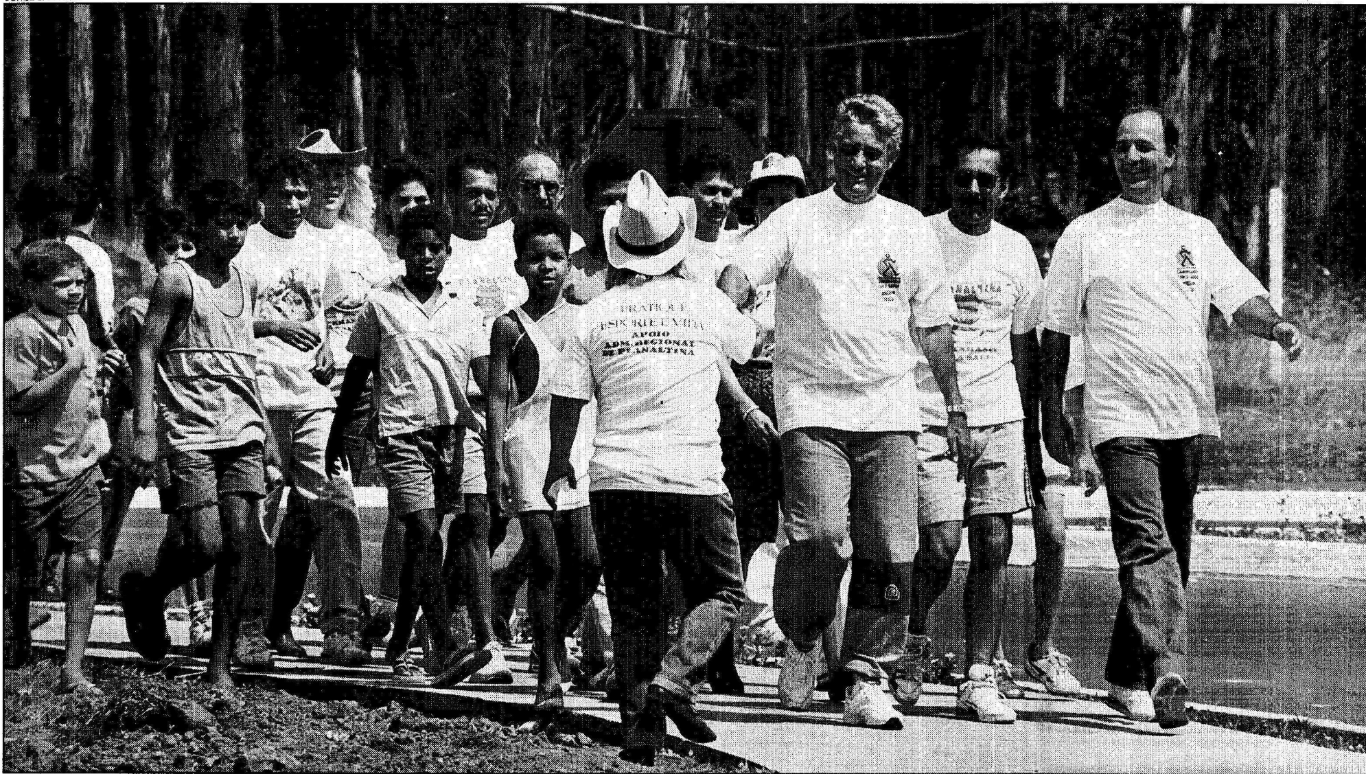
Roriz fez uma maratona no Parque da Cidade e satélites para lançar Caminhando com Saúde, que estimulará a prática de caminhadas e cooper sob orientação de profissionais