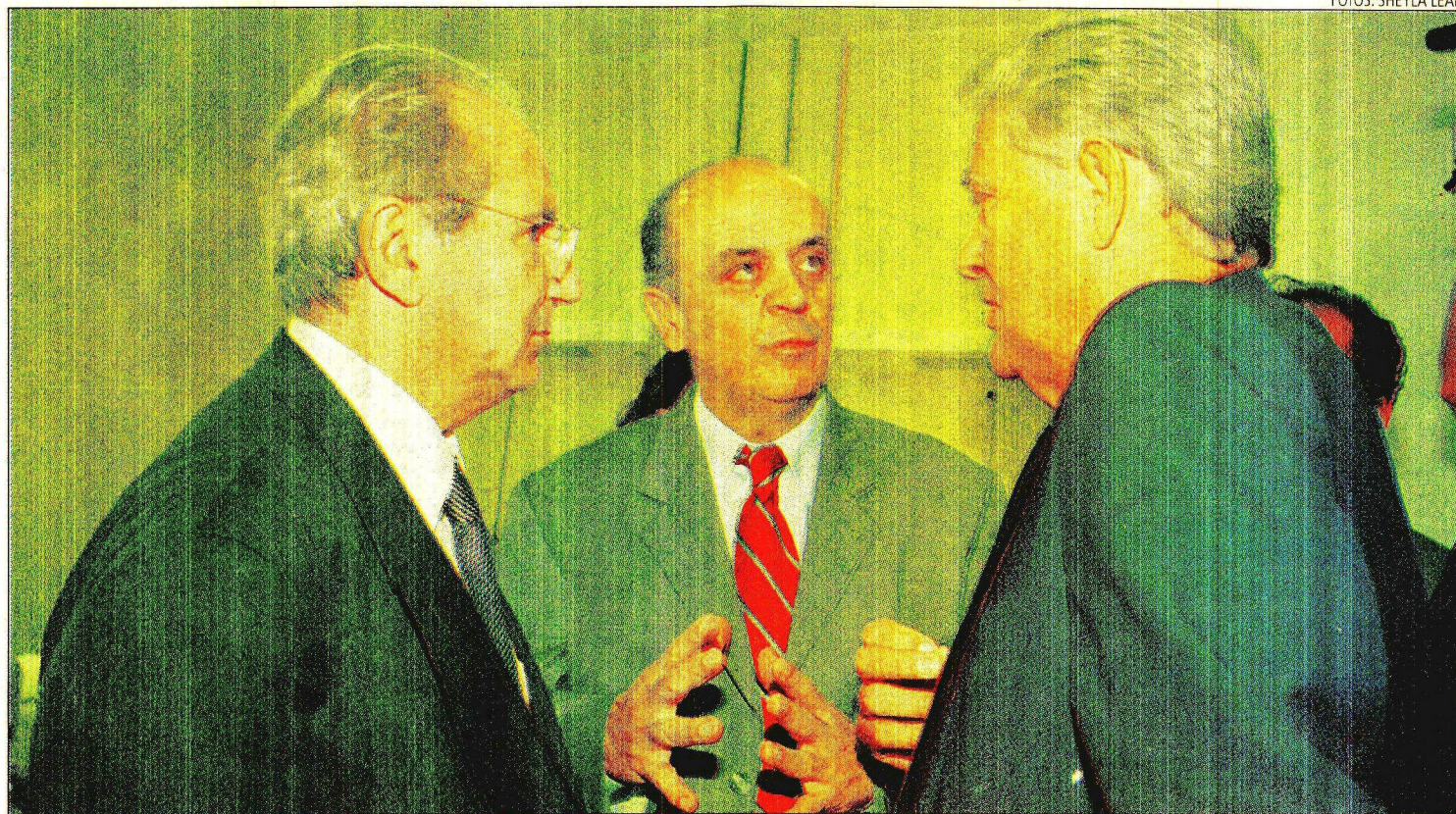
SECRETÁRIO JOFRAN Frejat, o ministro José Serra e o governador Roriz, durante a inauguração dos novos leitos do Hospital de Planaltina

O ministro disse que prioridade é investir na melhoria do atendimento materno-infantil. E ressaltou que a média brasileira de seis consultas de pré-natal para as gestantes é um modelo para o País.