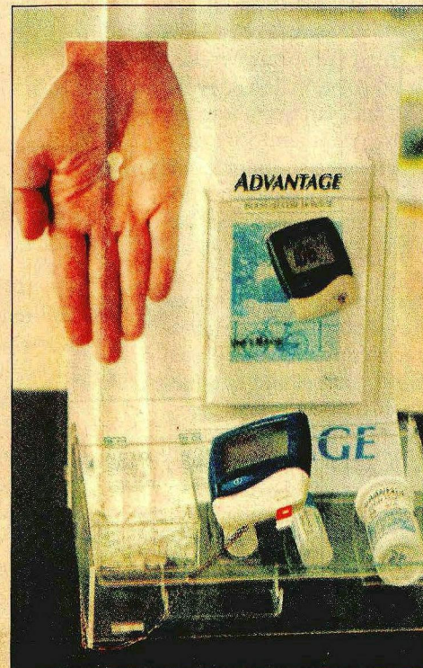
KIT para medir o colesterol e a glicose