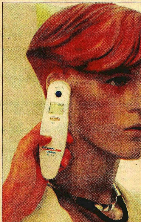
TERMÔMETRO: temperatura no ouvido