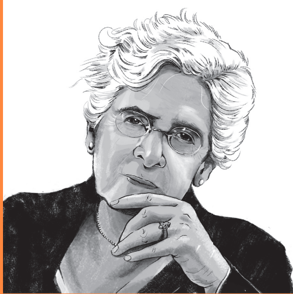
Júlia Lopes de Almeida