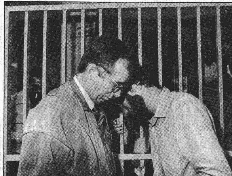
Clovis Cranchi Sobrinho/AE