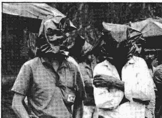
Renato dos Anjos/AE