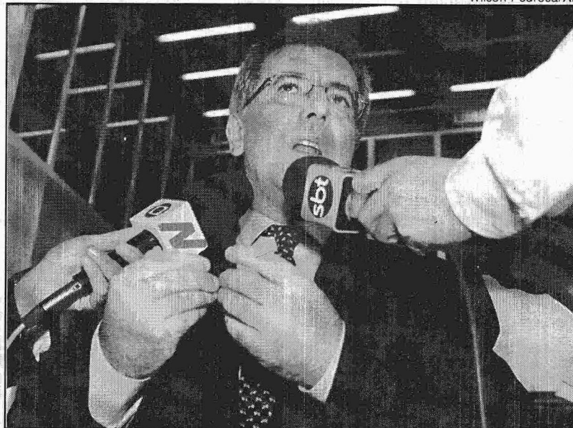
Kandir: “Algumas iniciativas ainda não foram formalmente adotadas”