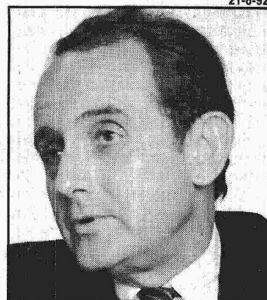
Gros: destruiria a indústria nacional

O argumento dos que garantem que o Governo não terá outra alternativa é que a inflação não cairá gradativamente, seja qual for o tamanho do aperto fiscal e monetário. Até porque não há antecedente histórico de que