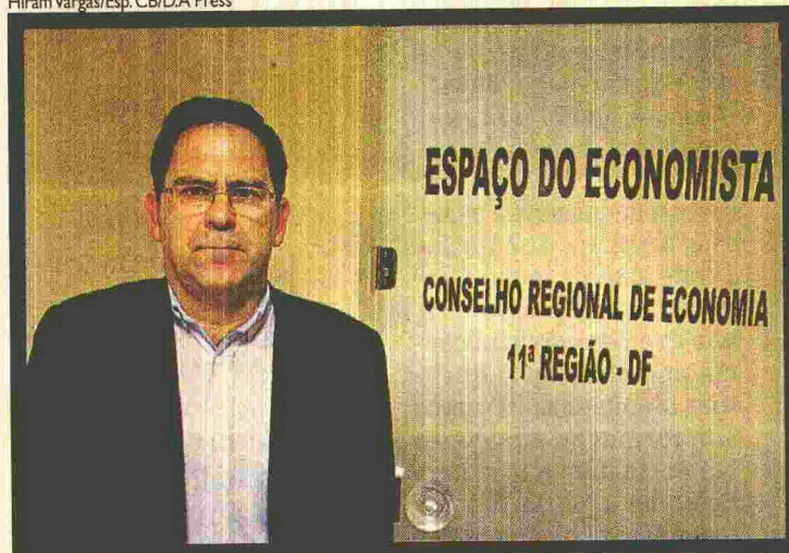
PEQUISADOR MIRAGAYA DIZ QUE AGRONEGÓCIO IMPULSIONA O INTERIOR

Mato Grosso) e a rodovia BR-163, no mesmo estado.