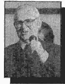
D. Paulo Evaristo Arns comanda um dos principais núcleos da Igreja que apóia o PT.