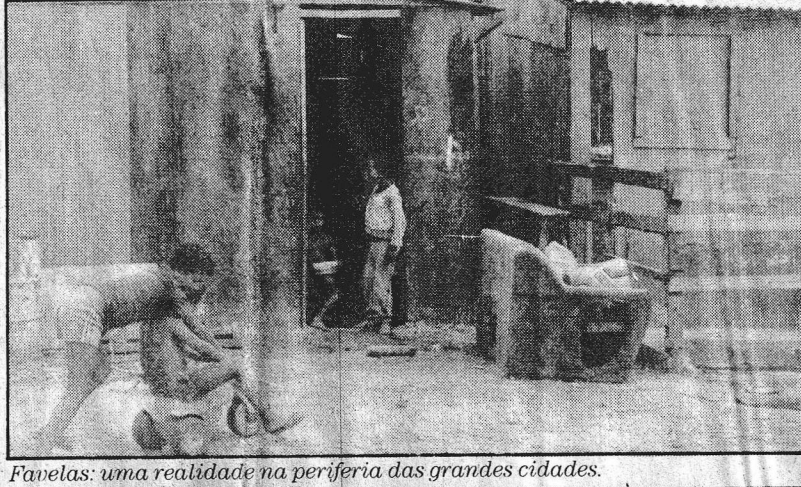
Favelas: uma realidade na periferia das grandes cidades.

O Brasil aplica 2,7% do PIB (estimado em US$ 360 bilhões para 1989) em educação, um pouco abaixo dos 3,2% das economias semelhantes e dos 4,7% dos países mais industrializados, e investe 2,0% do seu Produto Interno Bruto em saúde e nutrição (contra 1,2% dos países com o mesmo grau de desenvolvimento e 3,4% de países mais adiantados). Em habitação, seguridade e bem-estar social são investidos 3,2%. Mesmo com essa aplicação, conside-