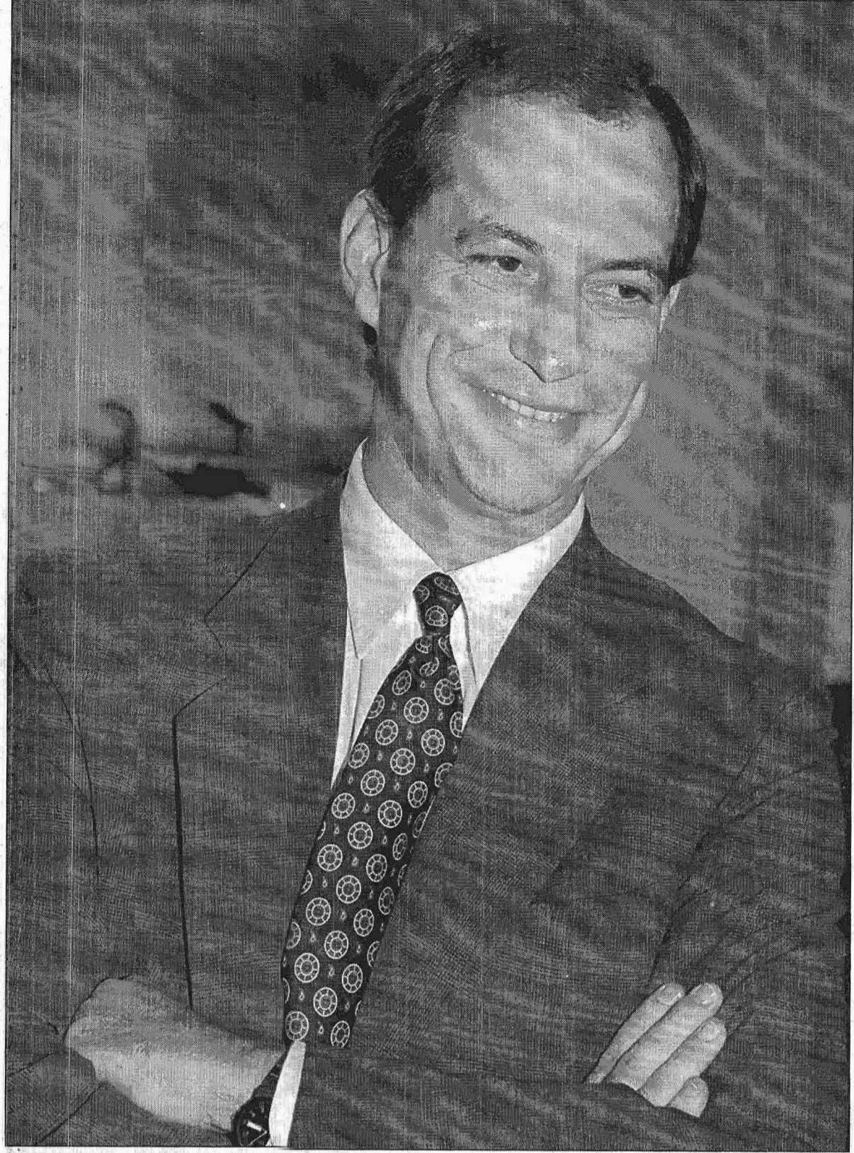
CIRO GOMES: venda de estatais para ajudar a pagar a dívida interna e tributação sobre o consumo, diminuindo o IR